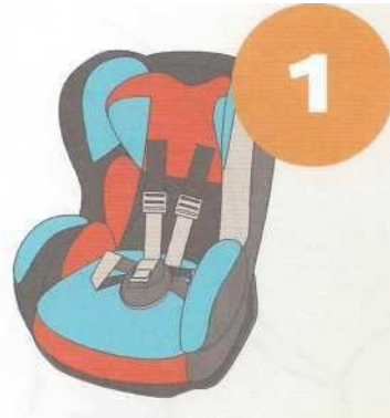
9-18 кг от 9 месяцев до 4 лет