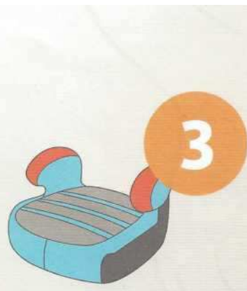
22-36 кг от 6 до 12 лет