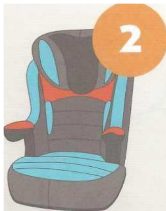
15-25 кг от 3 до 7 лет