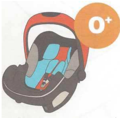
0-13 кг от рождения до 1 года

Покупайте кресло вместе с ребенком. Пусть он попробует посидеть в нем - прямо в магазине.